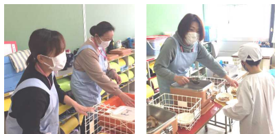
給食配膳のお手伝い

4月から、学校生活に不慣れな1年生のサポーターとして、給食や学習のお手伝いをいただいています。今年度は9名の方々にご協力をお願いし、毎日交代で活動していただいています。現在も、ご協力いただける方を募集中です。