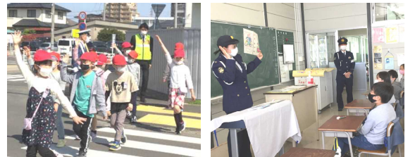
横断歩道を渡る低学年 教室で学習する中学年