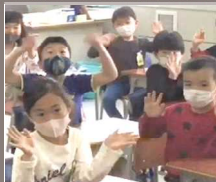
手を振って挨拶(1年)