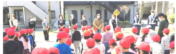
警察署、交通指導隊、PTA健全育成委員の皆さん

低学年と中学年の交通教室が行われました。低学年の子供たちは、実際に学校の周りを歩いて、信号のない歩道の安全な横断の仕方などを学びました。中学年は、教室で動画を視聴し、警察の方のお話を聞いて正しい自転車の乗り方等について考えました。警察署、交通指導隊、PTA健全育成委員の皆さんにご協力いただきました。ありがとうございました。